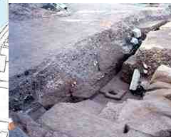
②江戸時代の地面と中世加納城の土塁(H11)