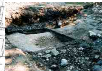
④本丸北堀の堀障子(H16)