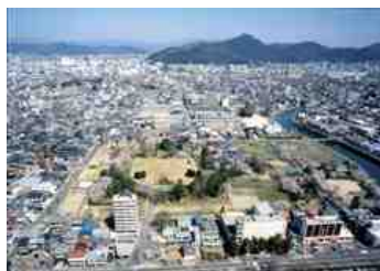
加納城南から北を望む

加納城は関ヶ原合戦後の慶長6年(1601)、徳川家康が現地を見分し、本田忠勝により、翌年から築城が開始されたとされる。その場所は、戦国時代に守護代の斎藤氏が築いた加納城(中世加納城)の跡地であった。