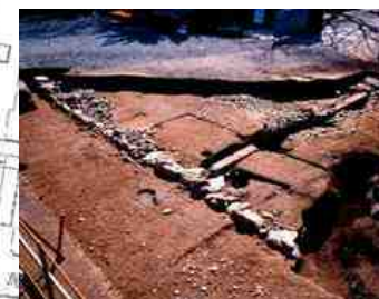
③本丸南門の内柵形(H11)