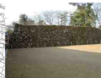
①本丸北面の石垣(現状)